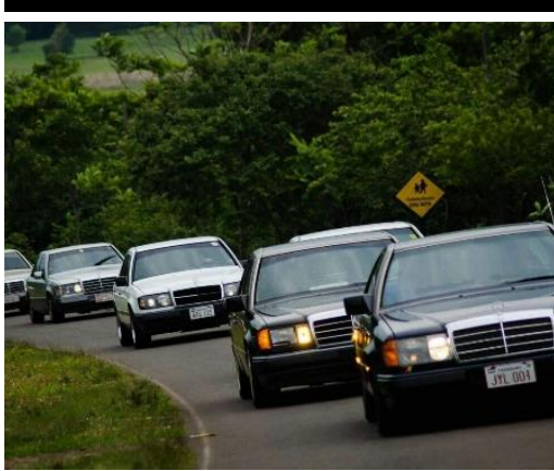
Viaje realizado al Guaira, camino a Colonia Independencia